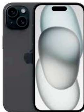
iPhone 15 Si supérieur à 15 000€