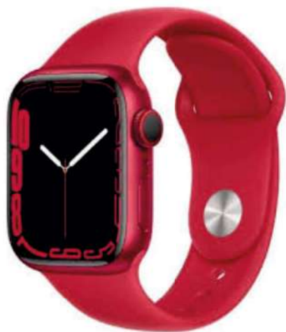
Apple Watch Si supérieur à 10 000€

Nous vous proposons des animations sur l'année. Faire évoluer le total des ventes sur la période de l'année par rapport à l'année 2023. De nombreux lots sont à gagner sur la période définie : 1 mars 2024 au 30 avril 2024